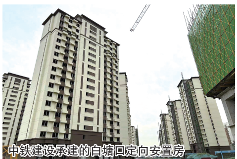
中铁建设承建的白塘口定向安置房