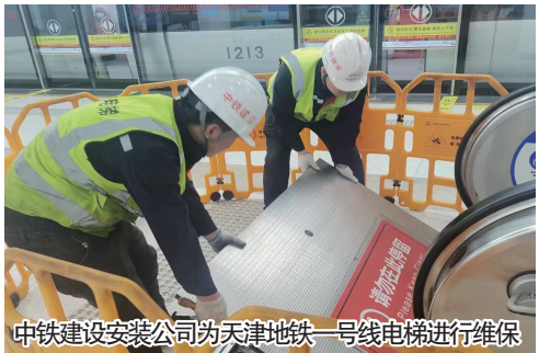
中铁建设安装公司为天津地铁一号线电梯进行维保

中铁建设安装公司主动融入京津冀协同发展重大战略,充分发挥电梯全产业链和专精特新企业优势,深耕津冀区域电梯及设备安装市场,涵盖住宅、商业、酒店、学校、医院等多种业态,共计安装维保电梯近2000台。