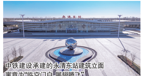
中铁建设承建的永清东站建筑立面 寓意“临空门户，展翅腾飞”

随着津兴城际铁路开通运营,天津与北京间搭建起继京津城际、京沪高铁、京唐京滨城际铁路后,又一条联通双城的高速铁路,天津西至大兴机场站间最快41分钟可达。廊坊市永清县结束了不通高铁的历史,为当地居民提供了更加安全、绿色、高效、舒适的出行方式。此外,天津西站、唐山站经津兴城际铁路首开到雄安新区高铁列车,唐山、天津和雄安三地紧密连接起来。