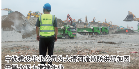
中铁建设华北公司为大清河区域防洪堤加固开展水泥土搅拌作业

去年夏天,受京津冀暴雨影响,天津海河流域发生流域性特大洪水。在这次防洪救灾过程中,中铁建设华北公司主动对接政府,助力当地开展防洪救灾工作,彰显了新时代央企担当。