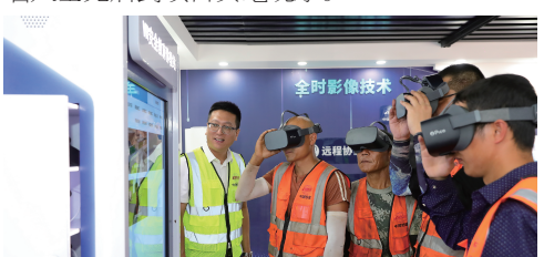
北方大数据中心VR安全教育体验站 工人戴上VR设备沉浸式体验工伤预防

与此同时,由该公司承建的北方大数据交易中心项目成为2023年在天津举办的第七届世界智能大会中“智慧城市、智慧工地”应用场景唯一观摩点,同年该项目还承办了天津市住建执法总队智慧工地观摩活动,吸引业内1000余名人士先后到项目实地观摩。