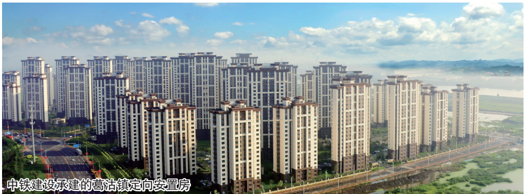
中铁建设承建的葛沽镇定向安置房

作为雄安新区建设的启动区,容东片区安置房项目承担着新区首批居民征迁安置的重任。由中铁建设华北公司承建的G3标段安置房