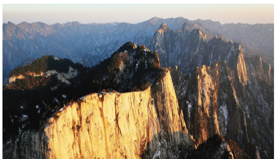
▲春节假期,位于陕西省渭南市的西岳华山迎来游览高峰,每天有超2万人次的游客登山观景。图为游客在华山西峰游览(2月12日摄,无人机照片)。