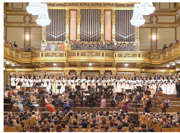
2024维也纳之声中国新年音乐会11日在奥地利首都维也纳金色大厅举行,庆祝中国农历甲辰龙年。这是2月11日在奥地利维也纳金色大厅拍摄的2024中国新年音乐会现场。