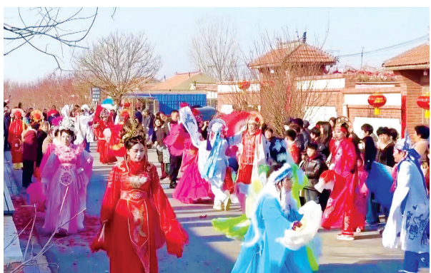
宁河区廉庄镇木头窝村民俗表演。