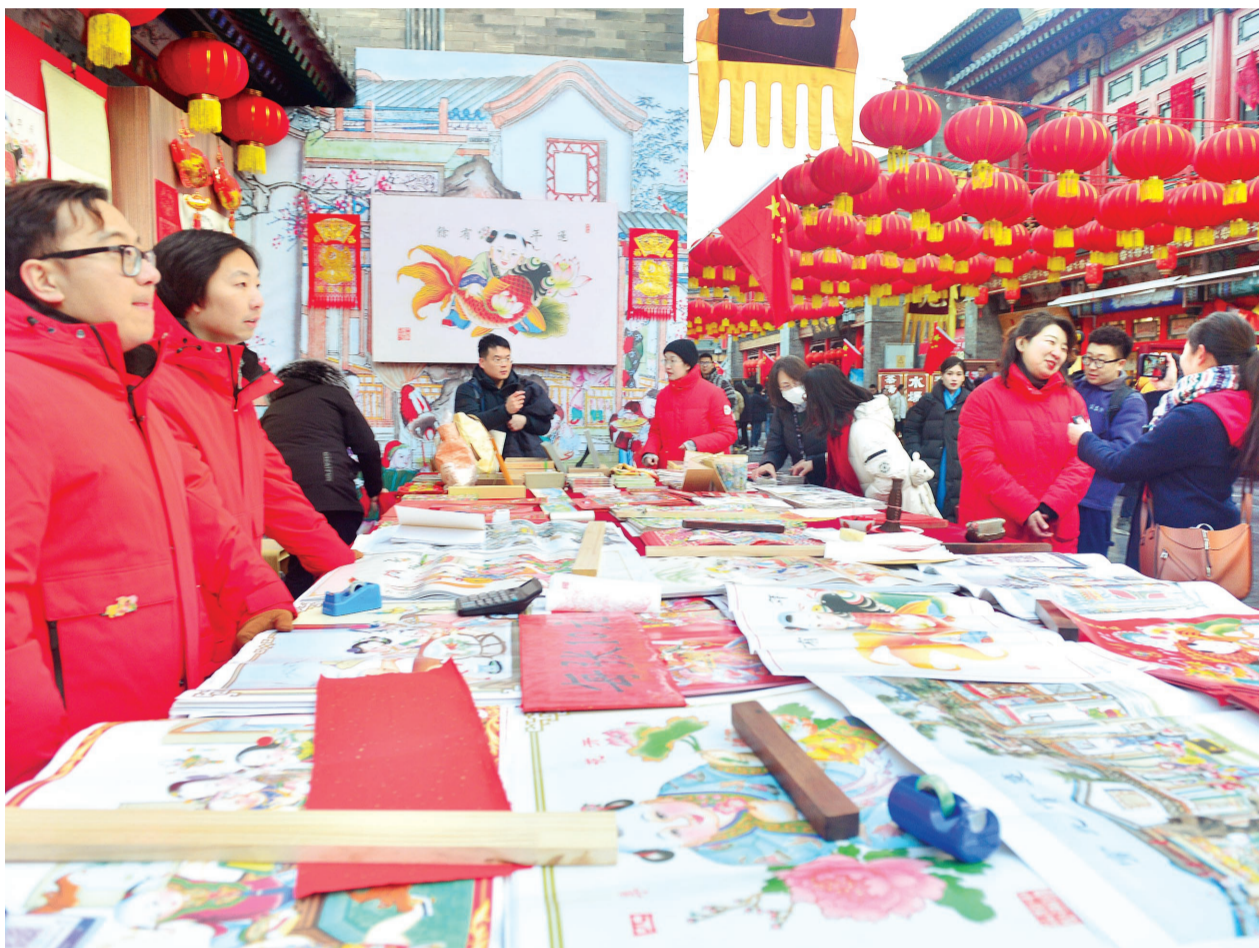
古文化街天津杨柳青画社的年画摊位吸引游客欣赏、选购。

“杨柳青年画的制作工艺采用‘半印半绘’的多色套印和手工彩绘相结合，工序繁多、绘制精细，视觉效果毫不逊色。”