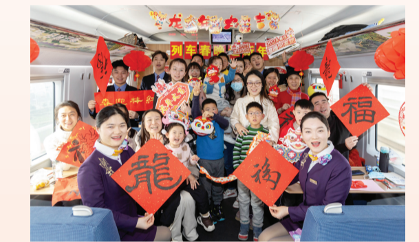
2月9日，铁路上海客运段G1426次列车举行“列车春晚迎新年”主题活动。