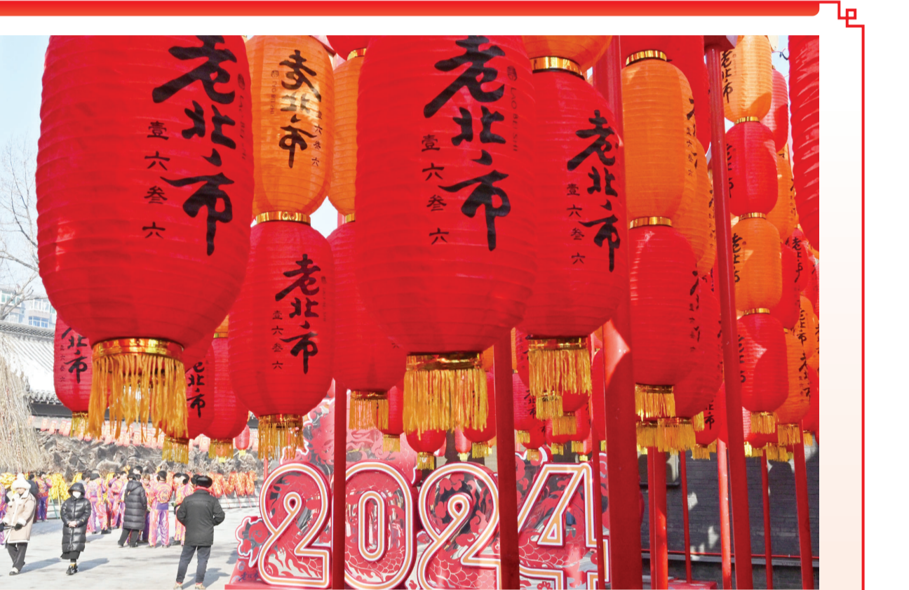
2月9日是农历除夕，全国各地洋溢着欢乐祥和的氛围，共迎新春佳节的到来。图为沈阳老北市大红灯笼高悬。新华社发