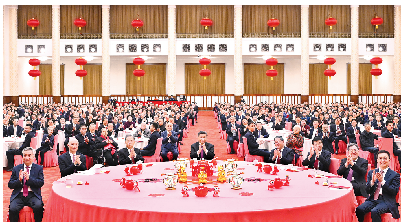
2月8日,中共中央、国务院在北京人民大会堂举行2024年春节团拜会。中共中央总书记、国家主席、中央军委主席习近平发表讲话。