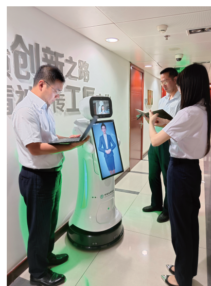
● 农业银行天津市分行科技研发人员对“手语智慧机器人”功能进行测试

深入实施数字化转型，推进金融服务融入生产生活场景，以数字金融服务千行百业、千家万户。深耕互联网高频场景，打造“津e生活”便民缴费数字平台，提升金融服务覆盖面和便利性。深化数字化渠道建设，提升掌上银行服务能力，每月为400余万市民提供线上金融服务。研发“手语智慧机器人”，为听障人士提供无障碍金融服务。打造46家户外劳动者服务站，为特殊群体提供上门服务8500余次，提升服务温度。