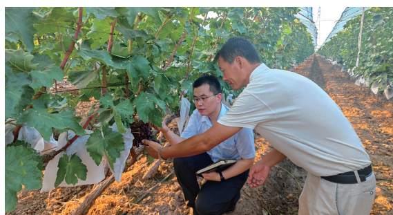
● 农业银行天津市分行金融支持种植户灾后重建，得到中央电视台报道肯定

把人民对美好生活的向往作为普惠金融发展的方向，深化“敢贷愿贷能贷会贷”机制，加大首贷、信用贷、中长期贷款投放，全年普惠贷款增加超80亿元，居可比同业第一；有贷客户近2万户，较年初增加超5000户。同业率先出台金融服务海河“23·7”流域性特大洪水受灾主体一揽子政策，发放3.4亿元贷款支持复工复产、灾后重建。持续向小微企业减费让利，有效减少市场主体融资成本。围绕居民消费升级新需求，推广“网捷贷”“助业快e贷”等特色产品，信用卡消费额居可比同业第一，助力天津打造国际消费中心城市。