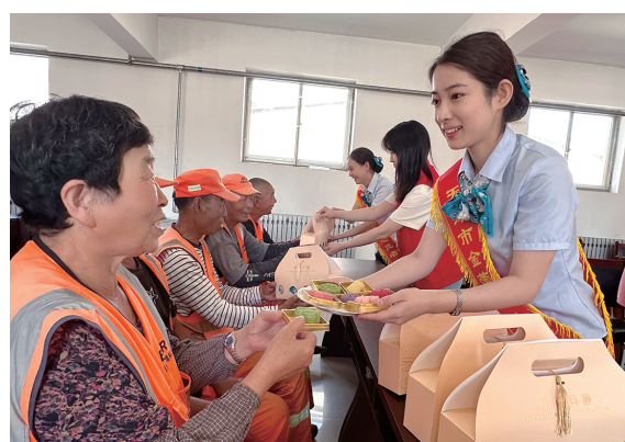
● 农业银行天津市分行辖属东丽支行开展“中秋送暖”慰问活动

深入践行社保卡大行责任，创新“社保+养老”服务模式，同业率先在全国社保卡服务平台推出个人养老金开户及生活缴费场景，截至2023年末，持有农行社保卡的市民超180万。积极参与构建个人养老多支柱体系，推出以个人养老金资金账户为核心的综合金融服务。做实“农情”适老服务，建设“农情服务标杆网点”，开设适老爱心服务窗口，设置无障碍通道、爱心专座，配备老花镜、轮椅等适老用品，提高老年客户到店满意度。