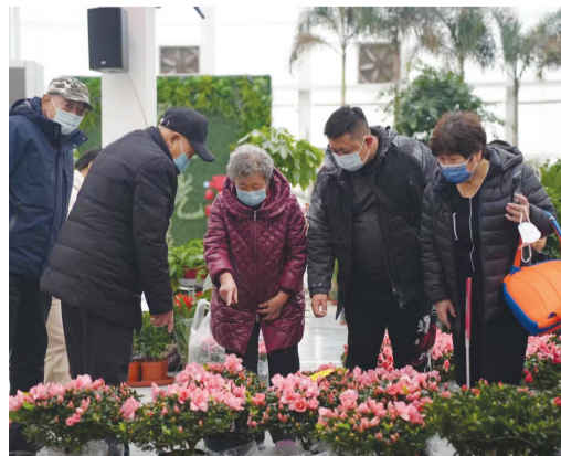
东丽湖花卉市场繁花似锦,逐渐热闹起来了。

东丽湖花卉市场“春节花市”的花卉品种多样,价格从十几元至上百元不等,能够满足市民的不同需求。周女士专门开车从市里来