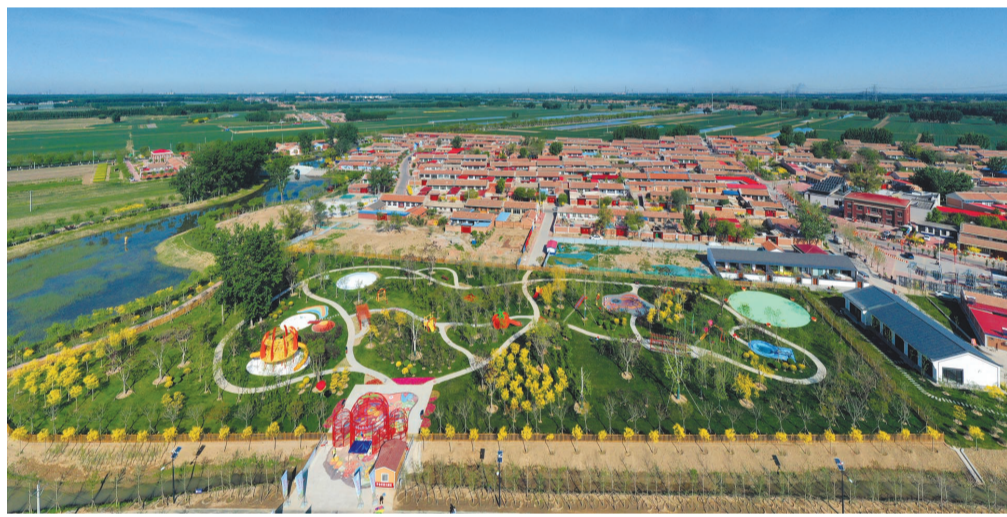
河北屯镇李大庄村大力发展文旅产业,古村落焕发新活力。(资料片)