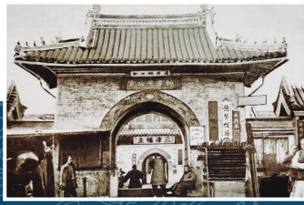
清末娘娘宫山门前集市