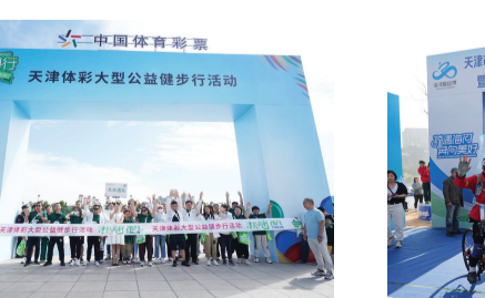
“津彩同行”健步行活动