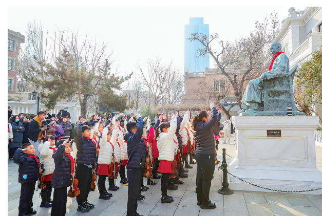
▲梁启超纪念馆已成为我市爱国主义教育的重要阵地。图为新年伊始，一场爱国主义快闪活动在梁启超纪念馆闪亮登场。