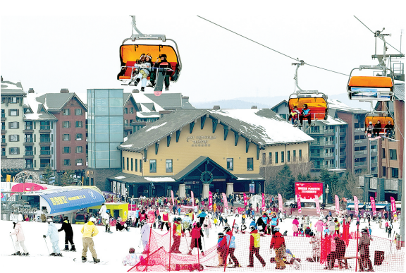
滑雪爱好者在吉林省吉林市万科松花湖度假区滑雪。