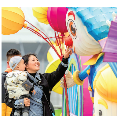
1月14日,市民在贵州省黔西市奥林匹克体育中心观赏花灯。