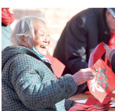
1月14日,在河北省石家庄市井陘县东山村,村中老人拿着书法爱好者送来的新春福字。