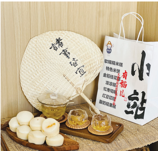
▲用小站稻制作的米糕