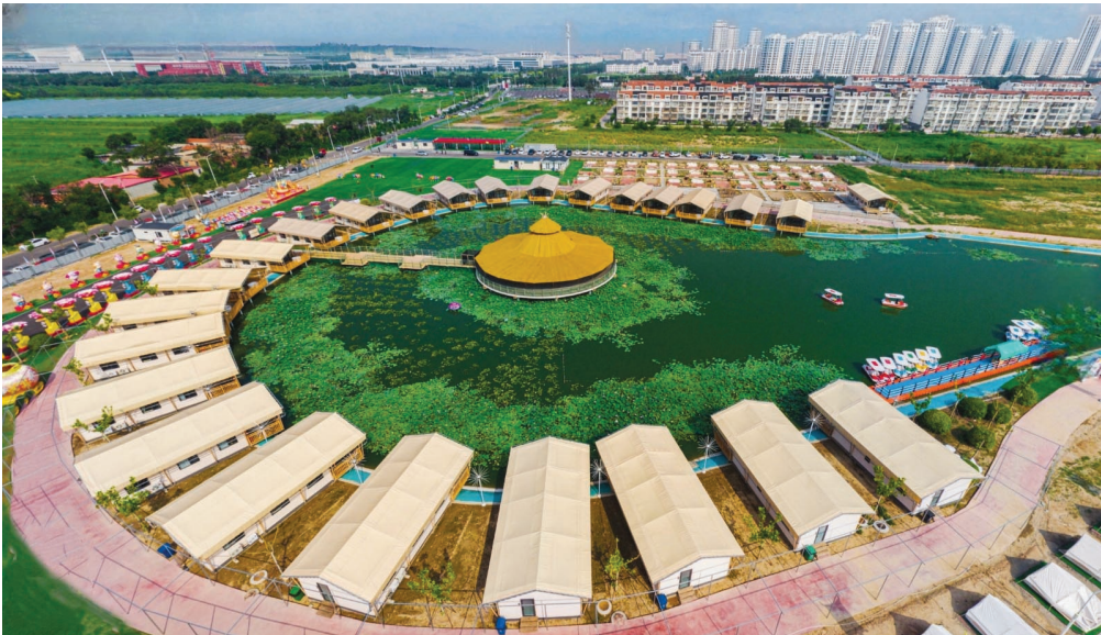
▲小站镇迎新民俗嘉年华