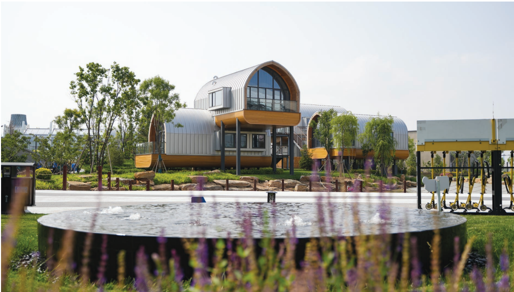
▲佳沃葛沽现代农业产业示范园

“下一步,我们将在打造特色产业上升级加力,积极探索适合我区条件和实际情况的发展模式,多渠道、多元化引入社会资本,充分发挥