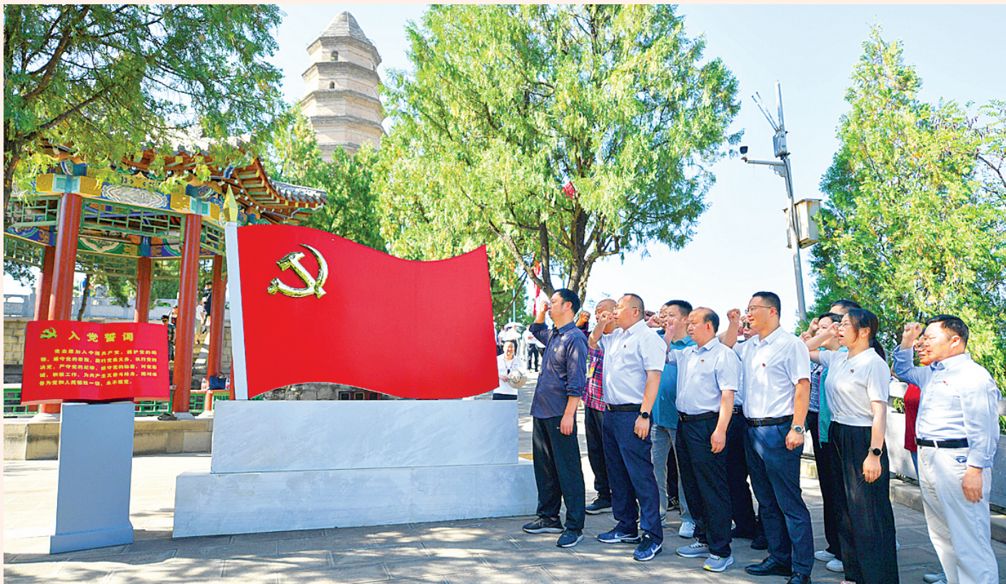
2023年6月30日，在陕西延安宝塔山参观的党员干部重温入党誓词。