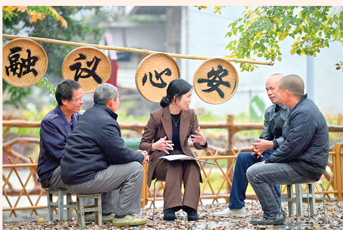
2024年1月5日，在广西融安县浮石镇六寮村议事协商主题广场，镇、村干部和村民在议事。