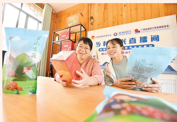
2023年10月8日，在广西柳州市融水苗族自治县安陞乡江门村，村干部带领同事在乡村振兴直播间准备直播工作。