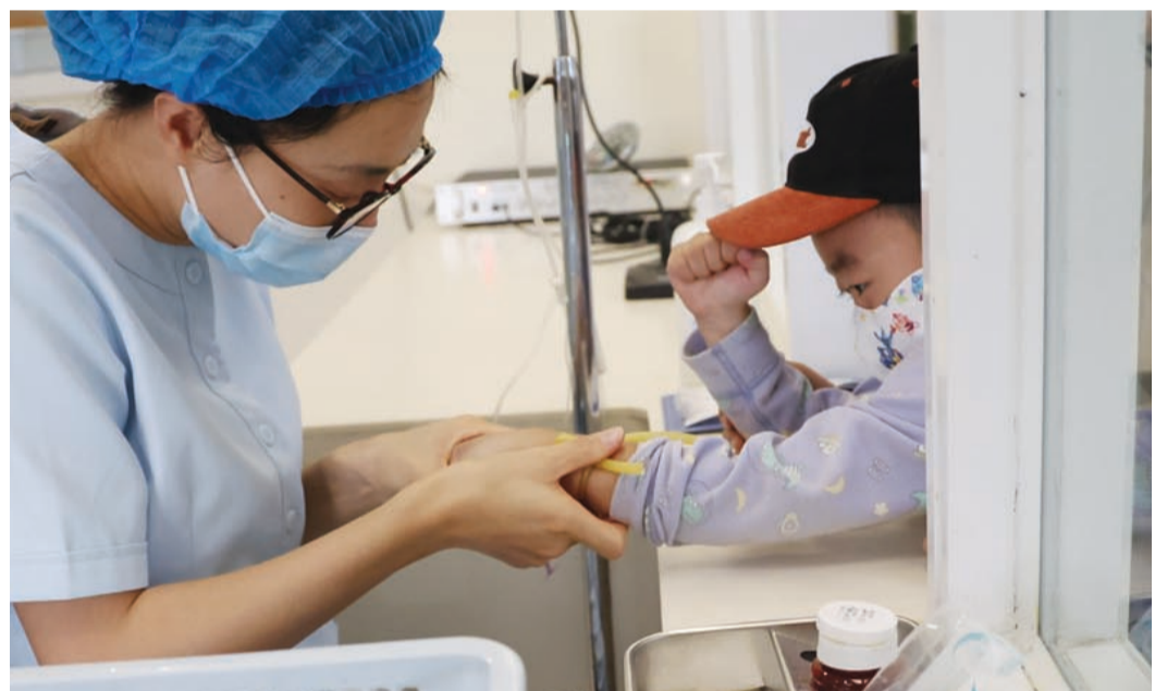
入冬以来,多种病毒感染叠加。人民医院儿科内小患者紧握拳头为自己鼓劲。