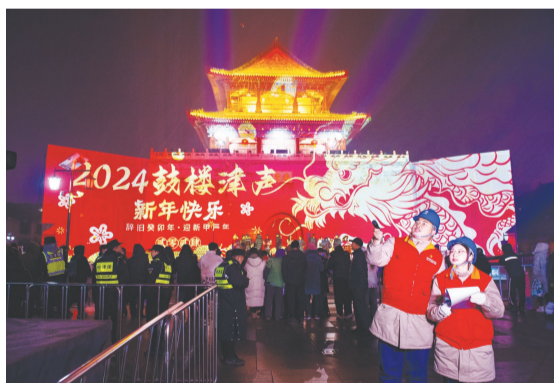
12月,鼓楼跨年仪式灯光秀系列活动现场,国网城西供电公司工作人员保电巡查。