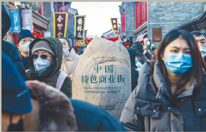
1月,古文化街人流如织,在疫情全面放开后的首个春节人们表情依然凝重。