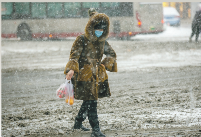
12月,最强寒潮来袭!广开四马路与黄河道交口,一位市民冒雪前行。