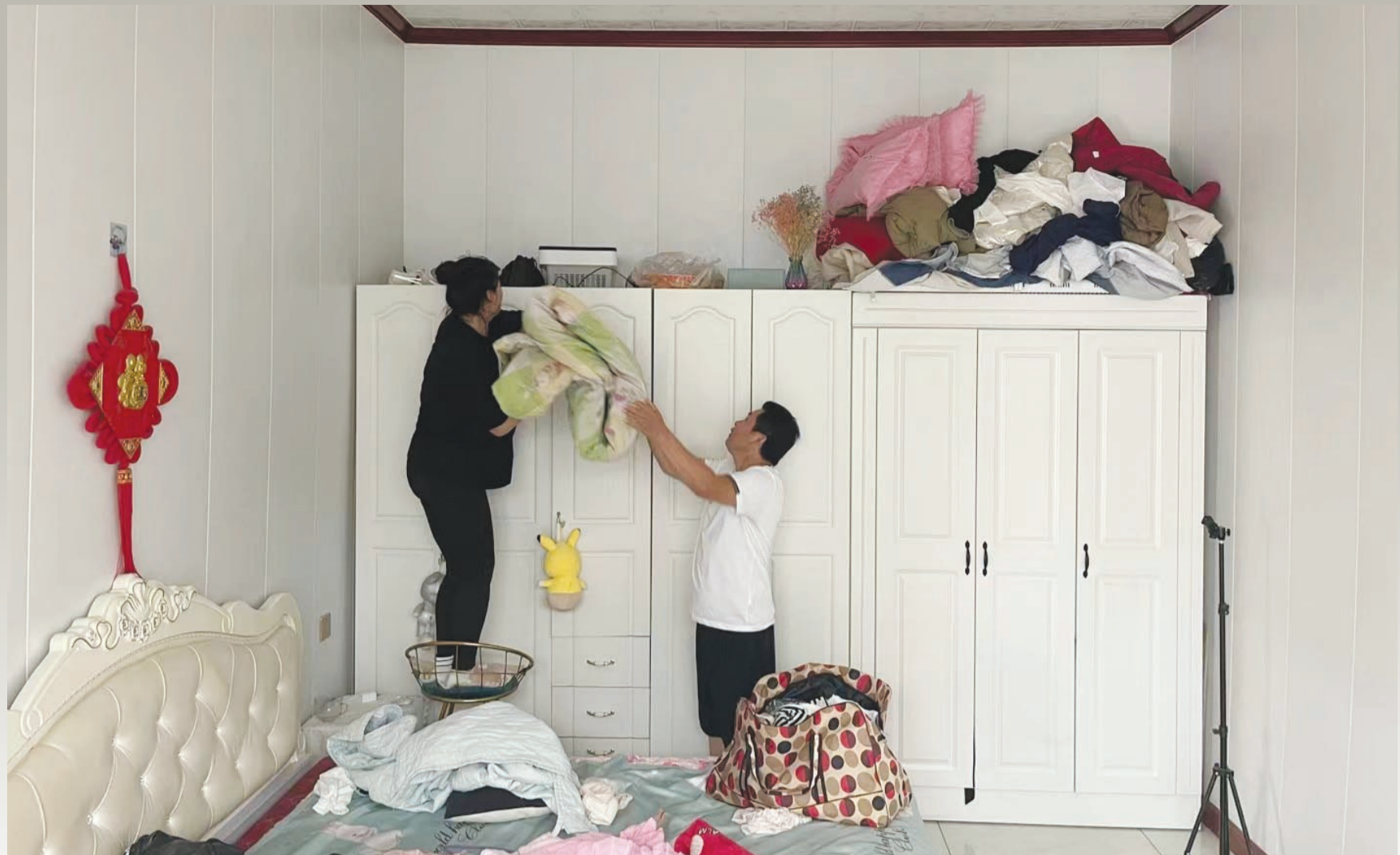
8月3日,洪水来临前,台头镇居民将生活用品放在柜子上以防被洪水浸泡。