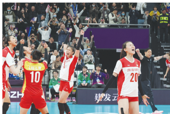
12月,天津渤海银行女排战胜巴西乌兰贝迪亚海滩女排,首次获得女排世俱杯季军。