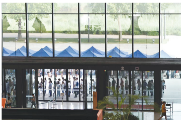
暑假,天津博物馆周末日客流量破万。工作人员在门前建起长达百米的遮阳凉棚。