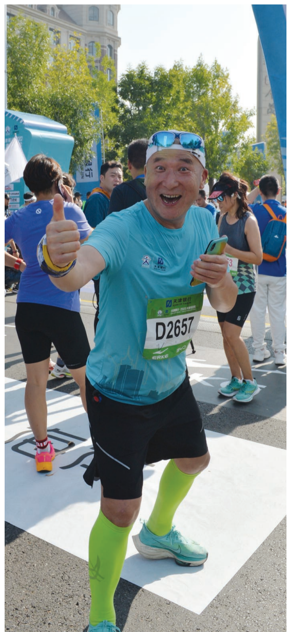
10月,时隔17年,天津马拉松重返市区开赛。