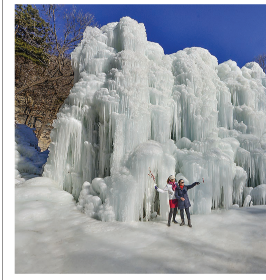
①游客在蓟州国际滑雪场尽情享受冰雪之乐。②游客在官庄镇玉石庄村趣园景区体验冰雪火锅。③游客在悦水梦园室内戏水区享受冬季戏水之乐。④小朋友在吉姆冒险世界丰富多彩的亲子体验,罗庄子镇蓟州国际滑雪场里正在上演的则是滑雪爱好者们的狂欢。⑤盘山景区打造冰瀑景观吸引游人前来打卡。

主打亲子娱乐的下营镇吉姆冒险世界把冰雪与健康作为今冬的一大主题,园区工作人员11月就忙碌起来,制造冰雪场景、检修维护相关设备,为冰雪主题做足准备。除了新开设的冰壶、冰上保龄球、曲棍球等冰上运动项目,还为小朋友准备了爬雪山、钻雪洞等趣味运动板块。夏日的漂流、小喇叭滑梯等水上项目升级成为冰雪滑道,机甲战车类的草地项目转战雪场,整个景区进入“冰雪运动”模式。