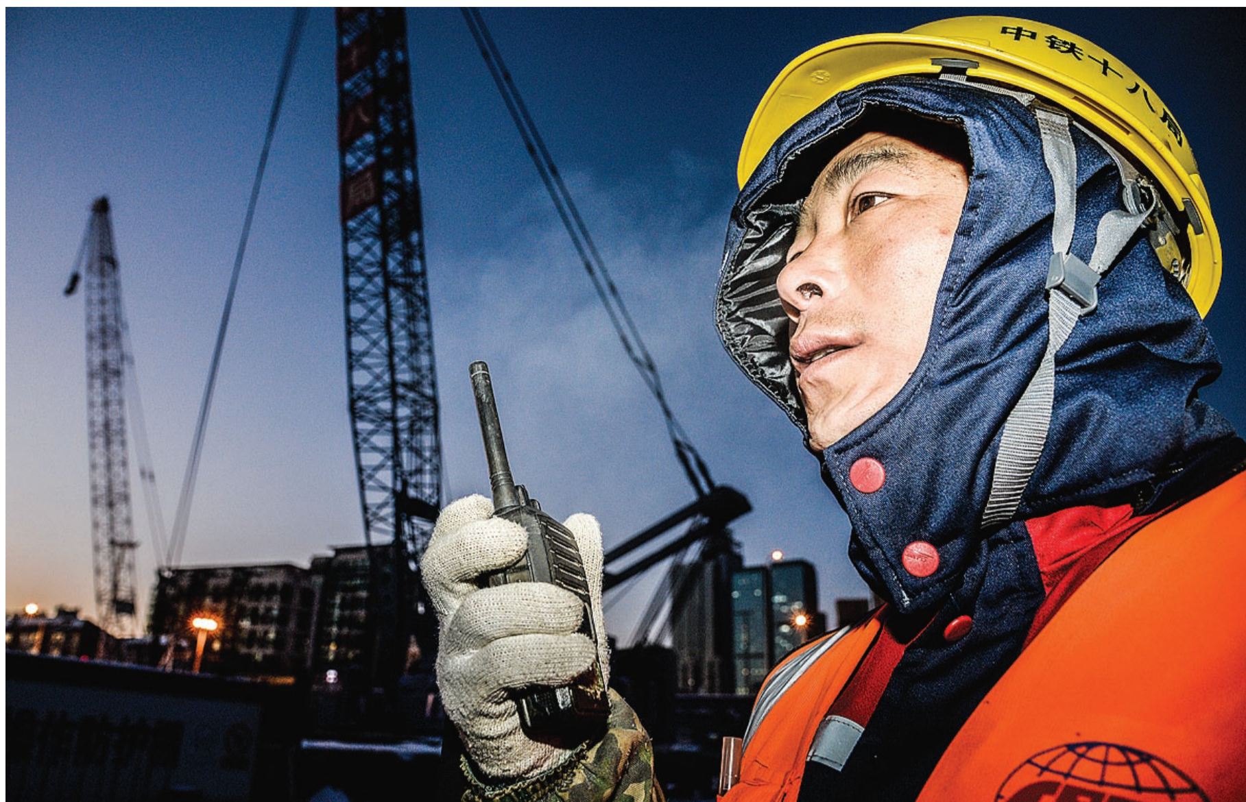
中铁十八局建设者在我市在建最深地铁站——下瓦房站冒着严寒指挥吊装,确保工程如期完工。

12月11日以来,随着今冬首轮大范围降雪到来,我市开启速冻模式。大雪加寒潮,持续低温考验着城市运转的每个环节。为了人民群众能够平安度过寒潮,为了重点工程可以正常施工,各条战线上,每个风雪之中坚守的身影,都为这座城市带来一种温暖,也为这座城市提升别样的温度。