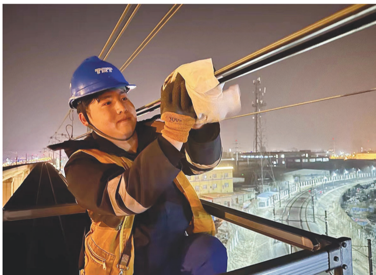
天津轨道交通运营集团接触网维修人员,连夜为地铁9号线露天段的接触网涂抹防冻液,保障列车安全平稳运营。