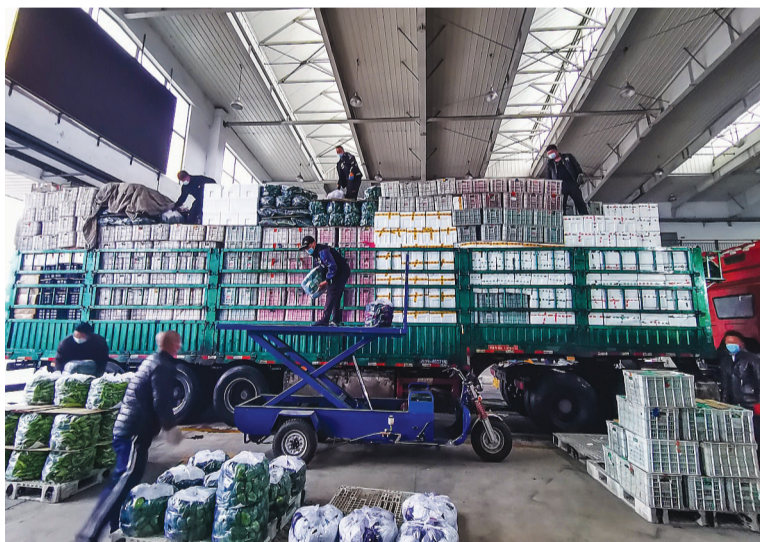
为做好寒潮期间我市“菜篮子”保供工作,位于静海区的深农集团天津海吉星农产品物流园每日蔬菜供应量保持在1.8万吨以上。