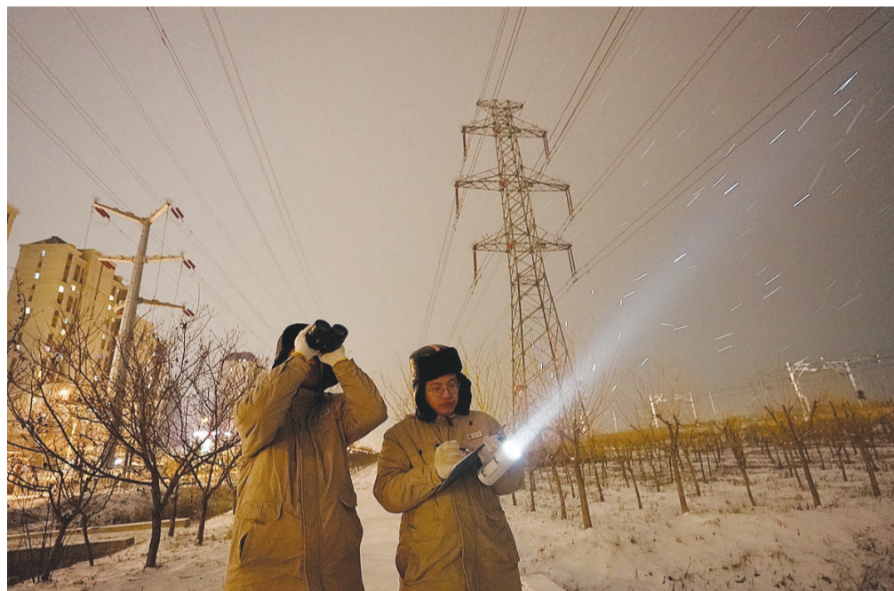
天津送变电公司线路运维人员在雪中对电厂并网线进行夜间特巡工作,保障电网供电安全,确保百姓温暖过冬。