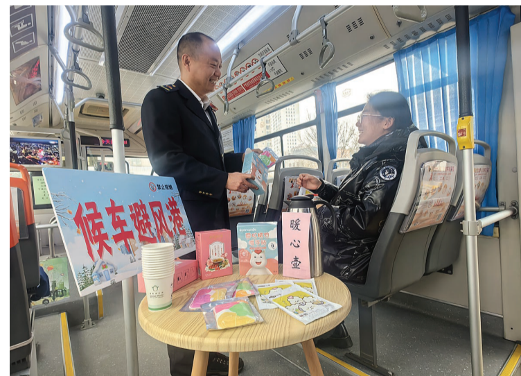
天津公交8路车队开启“候车避风港”,终点站启用闲置车辆,为乘客提供温暖。