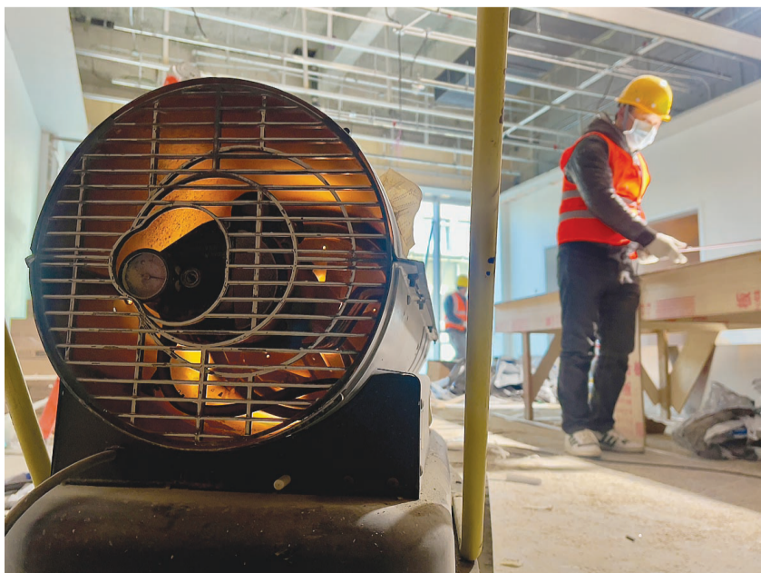
中建三局华北公司施工人员在人民医院扩建项目采用暖风机为建筑材料进行升温,确保低温下正常使用。