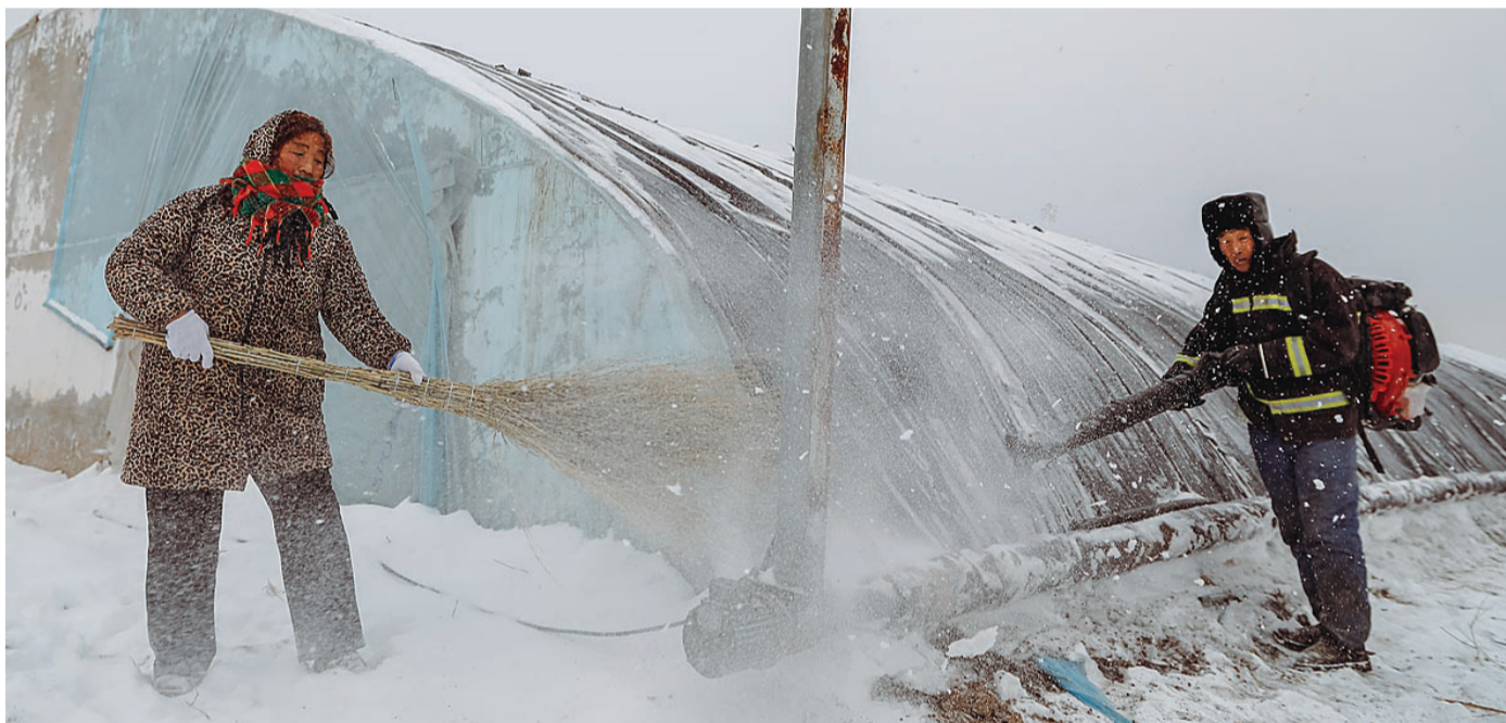
应对寒潮,保障农业生产安全,张家窝镇农业园区及时组织清扫棚顶积雪,减轻温室大棚承重压力。