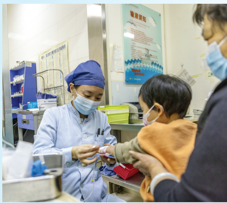
▲连日来,南开社区卫生系统开展“改善就医感受、提升患者体验”主题活动,全力守护寒潮低温下群众的身心健康。图为黄河医院护士给患儿打点滴。

本报讯(记者 曲晴)连日来,在绝大多数单位履行清雪铲冰责任义务的同时,有个别单位行动迟缓。对此,城市管理执法部门依据相关规定督促整改,13日至18日,累计发放《履行清雪铲冰法定义务提示函》49883份,督促整改问题2062处,处罚189起。