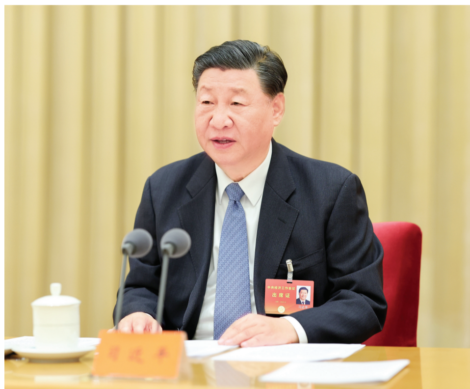
12月11日至12日,中央经济工作会议在北京举行。中共中央总书记、国家主席、中央军委主席习近平出席会议并发表重要讲话。新华社记者 姚大伟 摄

会议强调,做好明年经济工作,要以习近平新时代中国特色社会主义思想为指导,全面贯彻党的二十大精神,完整、准确、全面贯彻新发展理念,加快构建新发展格局,着力推动高