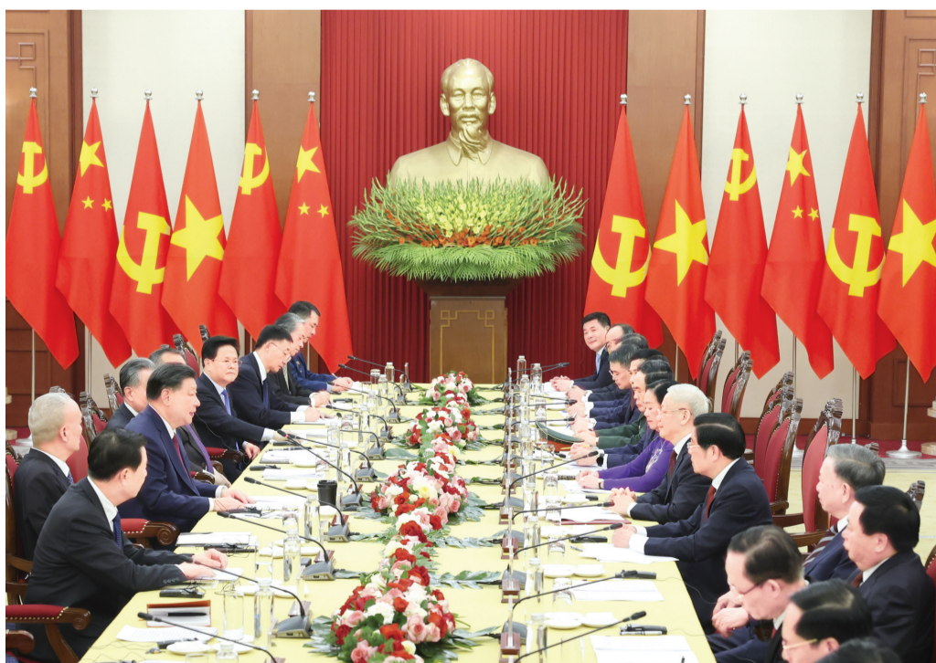
当地时间12月12日下午,刚刚抵达河内的中共中央总书记、国家主席习近平在越共中央驻地同越共中央总书记阮富仲举行会谈。

主席府广场庄严肃穆,金星红旗同五星红旗相映成辉,数百名欢迎儿童绽放的笑容灿烂明媚。阮富仲为习近平举行隆重欢迎仪式。习近平和夫人彭丽媛乘车抵达时,阮富仲夫妇在下车处热情迎接,越南少年儿童向习近平夫妇敬礼献花。两党总书记同双方陪同人员分别握手致意。习近平同阮富仲登上检阅台。军乐队奏中越两国国歌,鸣21响礼炮。习近平在