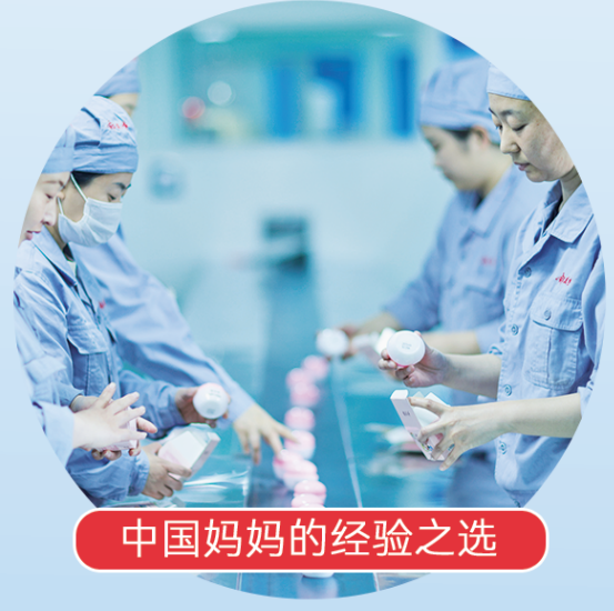
中国妈妈的经验之选