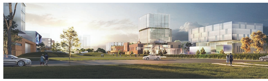
滨海—中关村北塘湾数字经济产业园效果图。