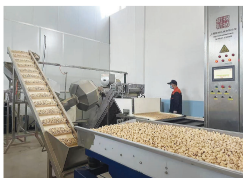
东旭盛坚果食品有限公司正在生产老式爆米花

据介绍，近年来，王口镇致力于打响王口炒货品牌。目前，全镇炒货企业注册品牌331个，其中天津市著名商标5个，拥有“王口炒货”集体商标。在发展过程中，王口炒货的摊子越铺越大，从传统炒货到各色坚果，再到零食全品类。为了扩大品牌影响力，王口炒货不仅在传统炒货的口味上推陈出新，在品类上也寻求升级。