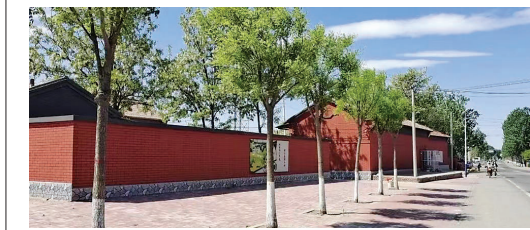
干净整洁的果粮务村。