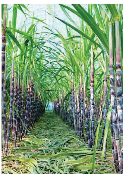
天民田园丰收期的甘蔗。