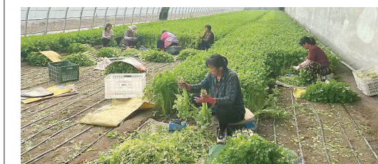
天民田园工作人员正在收芹菜。