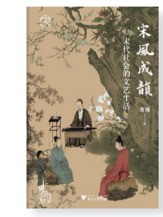
《宋风成韵:宋代社会的文艺生活》 黄博著,浙江大学出版社 2023年7月出版。

黄博在本书中对宋代文人生活圈有许多细致的展现,特别是宋代士大夫所擅长的诗词。宋人的玩法也超出一般人的吟和,更工于技巧,志于意境。王安石的集句诗首屈一指,甚至连苏轼也甘拜下风。集句诗就像是古诗中的大数据,将前人诗句重新组合成新诗,“既要诗意相连,又要平仄相合,还要对仗押韵”。