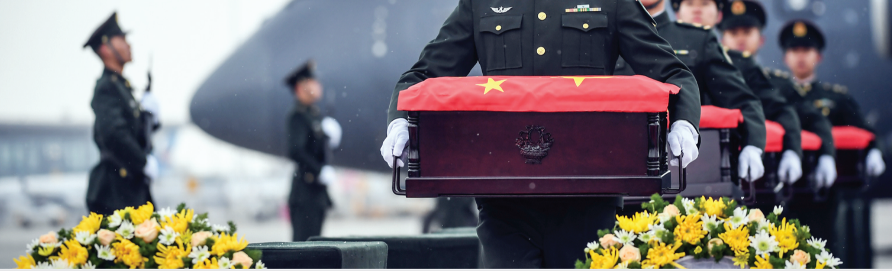
11月23日,在沈阳桃仙国际机场,礼兵将殓放志愿军烈士遗骸的棺槨从专机上护送至棺槨摆放区。