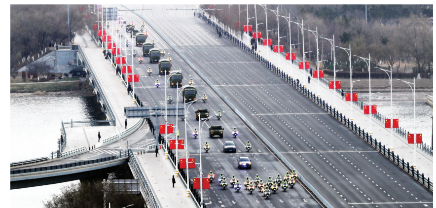
运送志愿军烈士遗骸的车队经过沈阳青年大街。