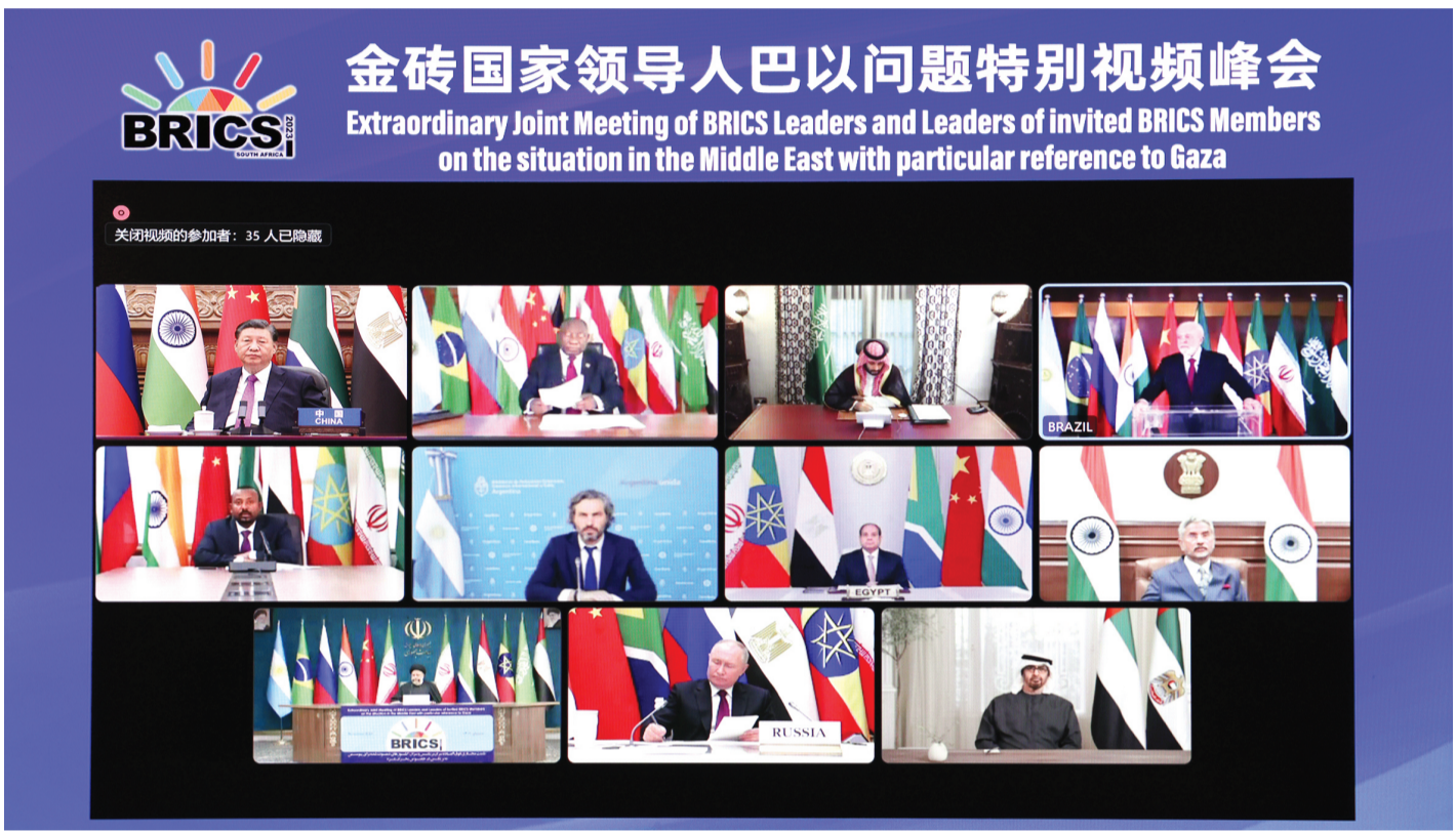
11月21日晚,国家主席习近平出席金砖国家领导人巴以问题特别视频峰会并发表题为《推动停火止战 实现持久和平安全》的重要讲话。