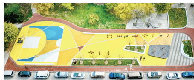
记者从天津经开区了解到,日前,经开区蓝领公园建成并投入使用,将满足天翔公寓、鸿发公寓及周边企业约6000人的休闲娱乐等需求。 本报记者 万红 赵建伟 摄影报道

实时在线,视频解答,申请材料“云指导”。针对申请人在准备申请材料过程中遇到的难点问题,工作人员随时上线解答,通过视频连线、线上传输等方式,逐字、逐行、逐件完善企业申请材料中的不规范内容,跨省远程指导企业填报信息,确保企业准备的材料完整准确。首办负责、协同合作,全程跟踪“云帮办”。