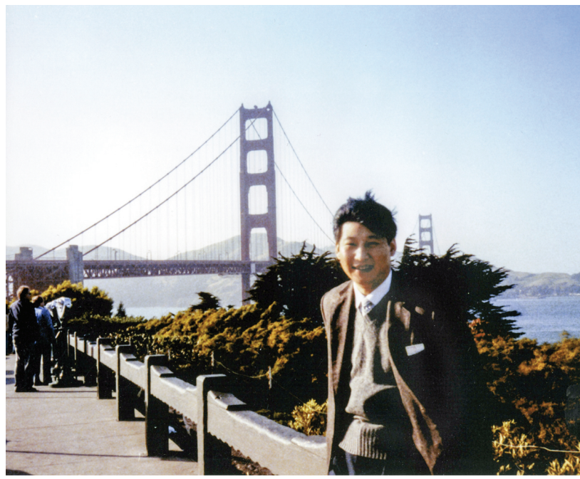
这是拜登展示1985年习近平在担任正定县委书记时访问旧金山的照片。