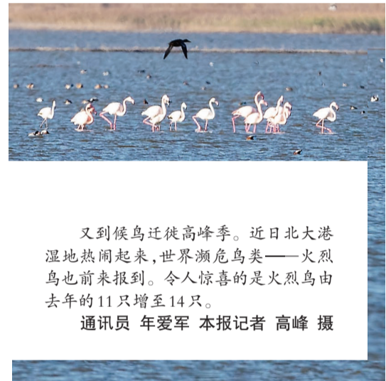
又到候鸟迁徙高峰季。近日北大港湿地热闹起来,世界濒危鸟类——火烈鸟也前来报到。令人惊喜的是火烈鸟由去年的11只增至14只。