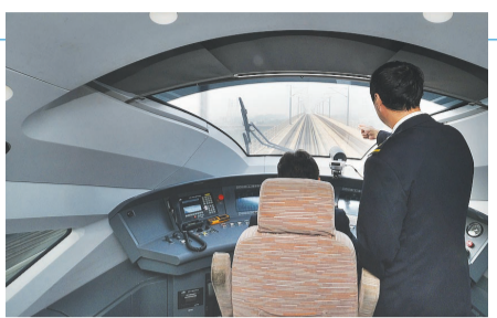
按图行车试验中,中国铁路北京局集团有限公司天津机务段司机正驾驶动车组列车行驶在津兴城际铁路上。

业协同,点燃着三地间的烟火气。更令人振奋的是,随着京津冀基础设施互联互通步伐加快,不仅是“轨道上的京津冀”,民航、公路等领域的喜人变化同样日日更新。