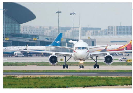
日前,在天津滨海机场一架航班正驶向跑道,准备起飞。

本报(记者 万红)初冬的寒意挡不住奋进的热潮,京津冀广袤的大地上交通基础设施互联互通的脚步蹄疾步稳。