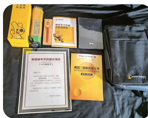
项目为骑手发放的入学“大礼包”

移动互联网时代,网约车司机、外卖员等新就业形态已深度嵌入公众的生活,也是劳动者们增加就业、增加收入的重要渠道。而美团“骑手上大学”项目,将为骑手们的职业发展提供更广阔的道路和可能性。据美团方面统计,超过50%的骑手有学习知识、提升学历的愿望。