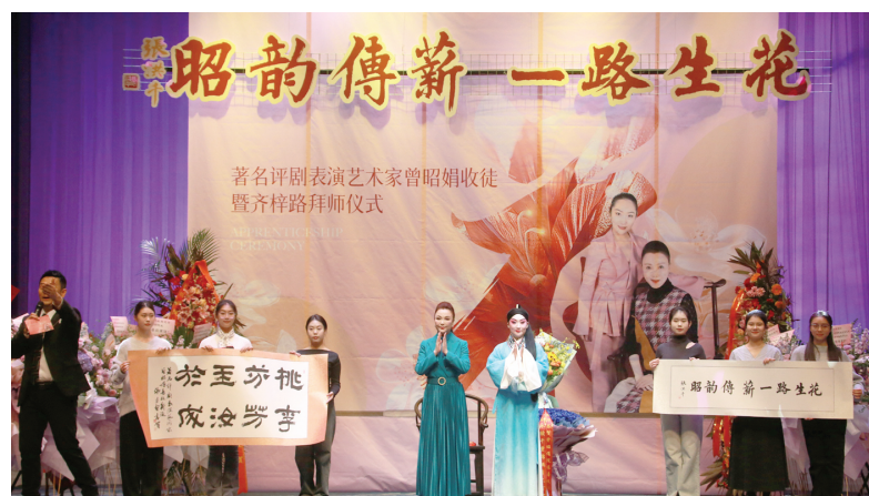
演出结束后,天津评剧院院长、二度梅得主曾昭娟收徒暨齐梓路拜师仪式。

路是个特别刻苦的孩子,总能屏蔽杂念,笃定、执着地打磨自己。作为中华优秀传统文化的继承者、践行者,我会将自己