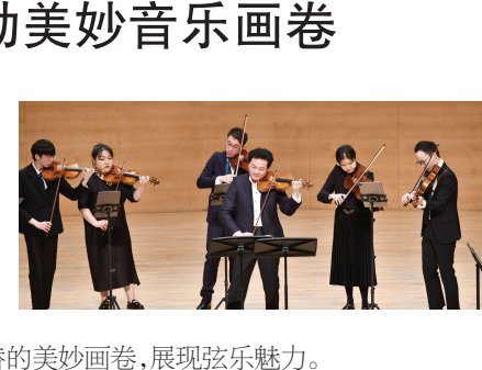
著名小提琴家吕思清携手美杰新青年乐团登上天津大剧院的舞台,演绎维瓦尔第与皮亚佐拉的“四季”,勾勒季节更替的美妙画卷。