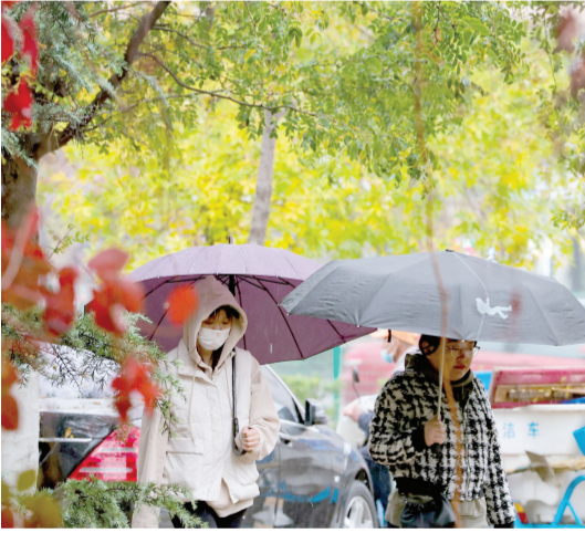
昨日,我市迎来降雨天气。图为市民在南翠屏公园雨中漫步。

推动搭建全流程线上融资渠道,为上游供应商提供自主注册、融资申请、合同签订等一站式金融服务,在控制风险的同时显著提升供应链上游中小微企业融资效率。“还好有你们,这下欠账和发工资的问题都能解决了!”看着到账的款项,某供应商负责人高兴地说道。 农业银行天津河北支行将不断创新优化服务,持续加大供应链上下游企业支持力度,让金融活水精准滴灌到中小微企业,为实体经济高质量发展提供有力支撑。