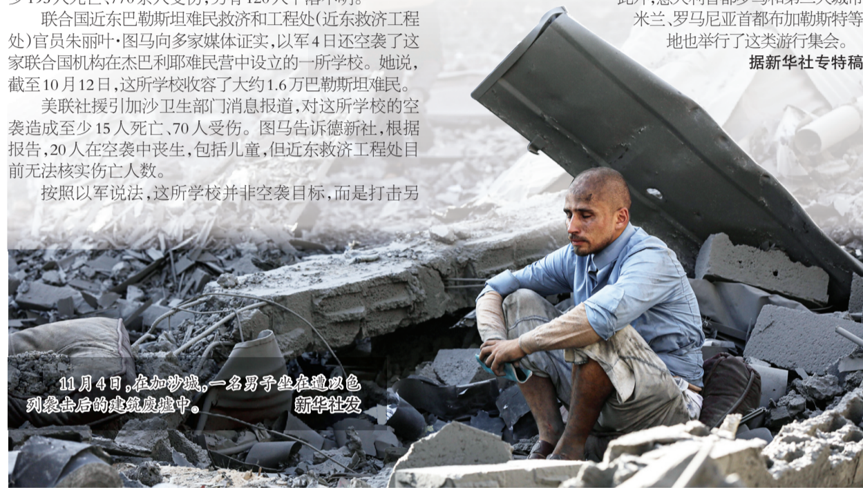
11月4日,在加沙城,一名男子坐在遭以色列空袭后的建筑废墟中。

尼泊尔处于地震多发地带。2015年4月,尼泊尔发生8.1级大地震,造成约9000人死亡。