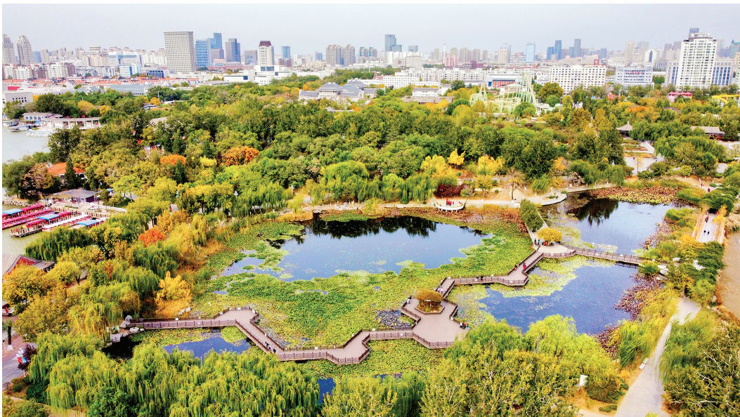
气温下降，秋意渐浓，我市各公园秋色迷人。