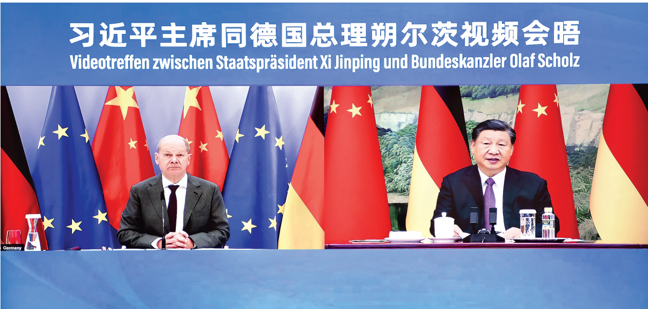
11月3日下午，国家主席习近平同德国总理朔尔茨举行视频会晤。