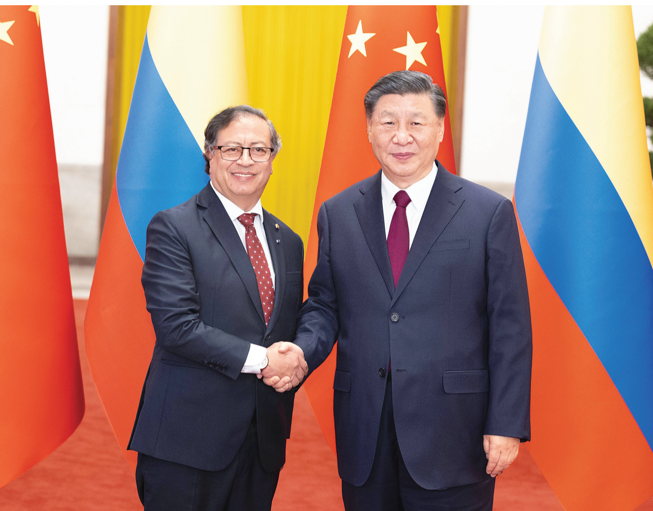
10月25日下午,国家主席习近平在北京人民大会堂同来华进行国事访问的哥伦比亚总统佩特罗举行会谈。这是会谈前,习近平在人民大会堂北大厅为佩特罗举行欢迎仪式。

新华社北京10月25日电(记者 刘华)10月25日下午,国家主席习近平在人民大会堂同来华进行国事访问的哥伦比亚总统佩特罗举行会谈。两国元首宣布,将中哥关系提升为战略合作伙伴关系。