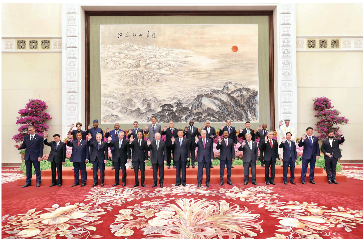
10月18日上午,国家主席习近平在北京人民大会堂出席第三届“一带一路”国际合作高峰论坛开幕式并发表题为《建设开放包容、互联互通、共同发展的世界》的主旨演讲。