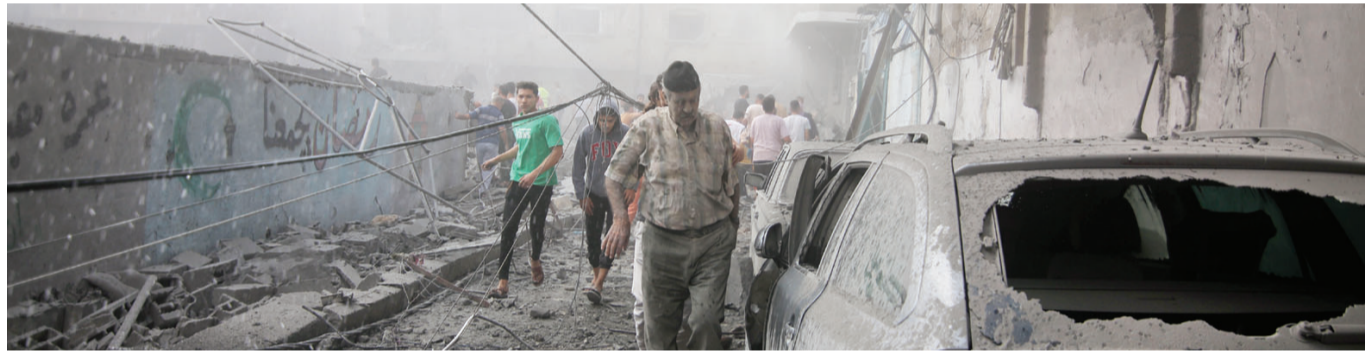
10月12日,在加沙地带南部城市拉法,人们在遭以色列空袭的受损建筑中救援伤者。

声明说,双方还讨论了双边关系。莱希表示,伊朗愿改善和深化同沙特的关系,认为这有助于建立、维护和促进本地区的安全与稳定。穆罕默德·本·萨勒曼说,沙特和伊朗致力于共同努力改善地区局势,希望双方的合作可以在迅速结束巴以冲突方面发挥作用。