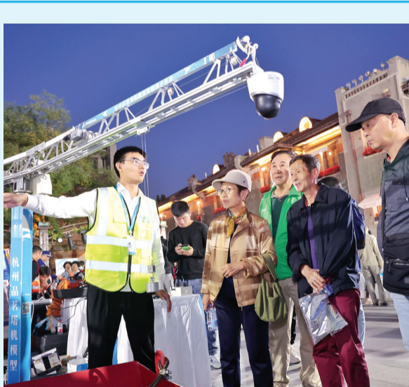
昨日,12350安全生产举报主题宣传日活动在意大利风情街举办。