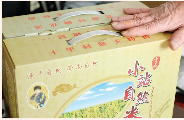
小站稻搭上了物流快车。