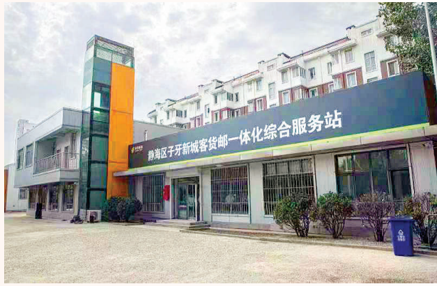
静海区子牙新城“客货邮”服务打通快递进村“最后一公里”。