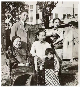
（前排与满姑（二排右）等家人的合影） 幼时期的本文作者

满姑的母亲名叫曾纪芬,是晚清重臣曾国藩最小的女儿,自幼饱读诗书,又善于理家,一生以《文正公家书》教育家人。所以这个家庭的子弟全经过家塾培养,再选读必要的西方书籍,个个知识广博,视野开阔,女孩也不例外。只是满姑除了各种典籍外,还喜欢中医,家里又为她请了一位上海有名的女中医加以指导。