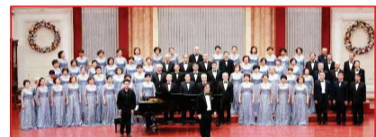
日前,庆祝中华人民共和国成立74周年暨第十九届天津·城市之光合唱音乐会在天津音乐厅举行。

述了一代人在特有的社会条件和际遇中谋划人生、创造历史的故事。 映后,活动现场气氛热烈,学生们分享自己的观影感受。如同电影里的王浩宇一样,现实中的青年学子也正经历创业探索,对此,出品人王哲涵讲述了自己在创业过程中遇到的事业危机及独特的商业逻辑,并表示要学会忍耐、学会变通,希望大家能在影片中获得成长的力量。 该片由天津电影制片厂、天津北方电影集团等共同出品,目前正在院线热映。