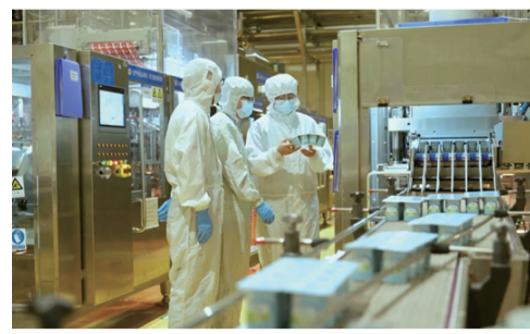
质检人员与生产人员查看盖膜封合效果和设备参数,商讨解决方案。