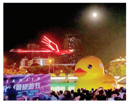
“天津2023金秋海河文化体育旅游节”昨晚在津湾广场开幕,图为无人机搭载“火凤凰”点亮“海河游鸭”。

本报讯(记者 廖晨霞)昨晚,由市委宣传部、市委网信办、市国资委、市文化和旅游局、市体育局指导,天津旅游集团主办的“天津2023金秋海河文化体育旅游节”在津湾广场开幕。 据介绍,海河文化体育旅游节期间,天津旅游集团发挥国资文旅资源协同发展“链主”单位作用,统筹协调14家国资集团,将以“大运河—海河”项目中首座新建成的码头——津湾游船码头试开航为契机,结合服务“2023天津马拉松”赛事活动,推出各种精彩纷呈的文化、体育、休闲活动,呈现40个文旅消费场景,全力打造文旅商康体综合业态,引入天津津津、释放消费活力。