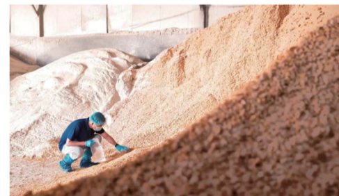
质量人每天检查饲草新鲜度并进行抽样检测。