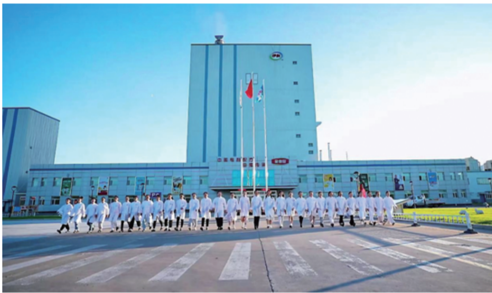
奶粉工厂大楼前的“质检女团”。

地下笔;质量管理工作也一样,每一个消费者反馈都很重要,都要全心全意地对待,才能为消费者提供品质更好的产品。” 事实上,在韩岩灼心底,还有一段有关伊利的“独家记忆”。在甘肃老家上学时,他曾是伊