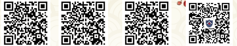
(排名不分先后) 天津长安网 天津市公安局 北方网 天津市见义勇为协会