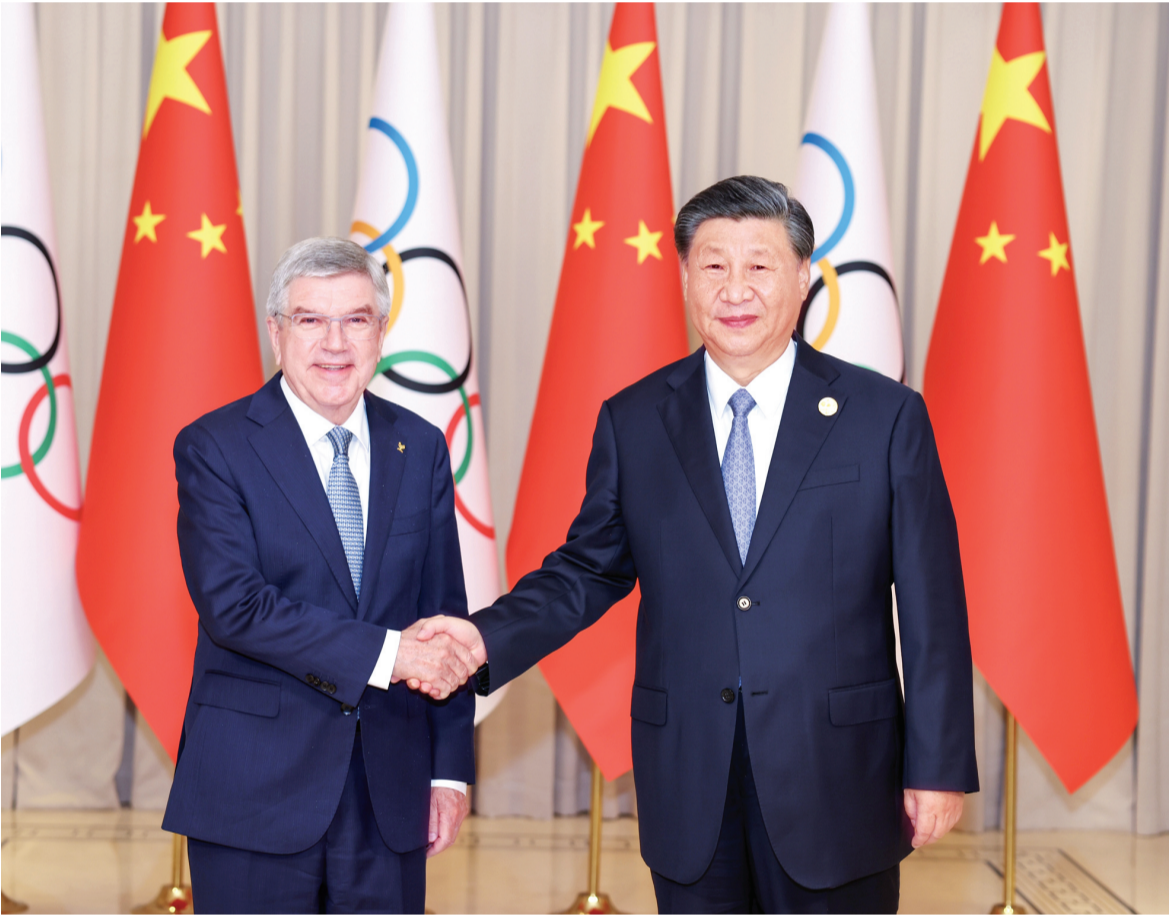
9月22日下午,国家主席习近平在杭州西湖国宾馆会见来华出席第19届亚洲运动会开幕式的国际奥林匹克委员会主席巴赫。