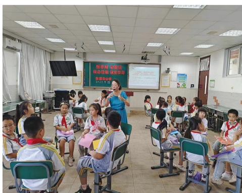
孩子们在心理健康专题课上受益匪浅。

有了服务的“阵地”,还需要专业的团队。为此,大张庄镇采取购买服务的方式,引入由国家二级心理咨询师组成的专家团队,为居民提供心理健康、家庭关系、儿童教育等专业领域的支撑指导。同时,依托“文明实践志愿服务”成立心理健康服务队,工作人员来自该镇机关工作人员、村委会工作人员、社工、网格员、医护人员等,以各自领域的工作为“触手”,发现身边人的困惑烦