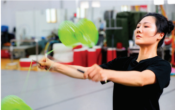
台上一分钟,台下十年功。杂技演员全神贯注地练习抖空竹。