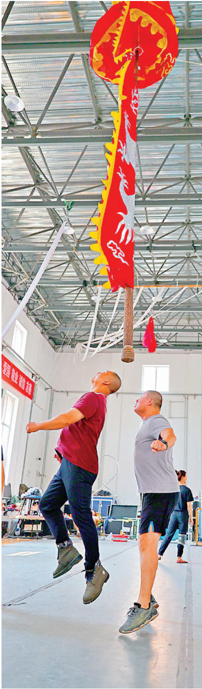
在演员头顶传递的中幡。