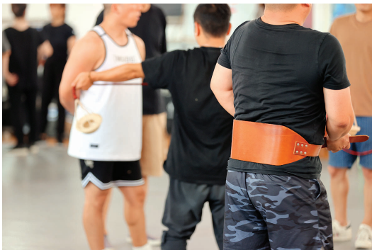
所有的伤痛只为台上精彩的几分钟。对于杂技演员来说,护腰是标配。