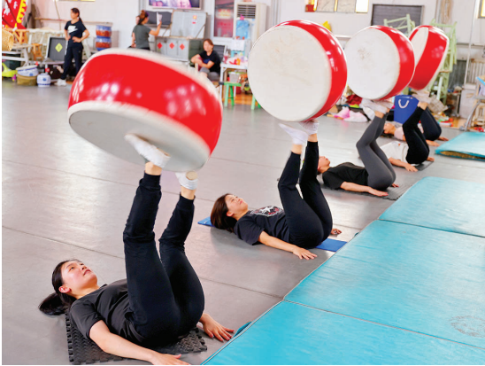
整齐划一的蹬鼓项目,是训练中日复一日累积的默契。