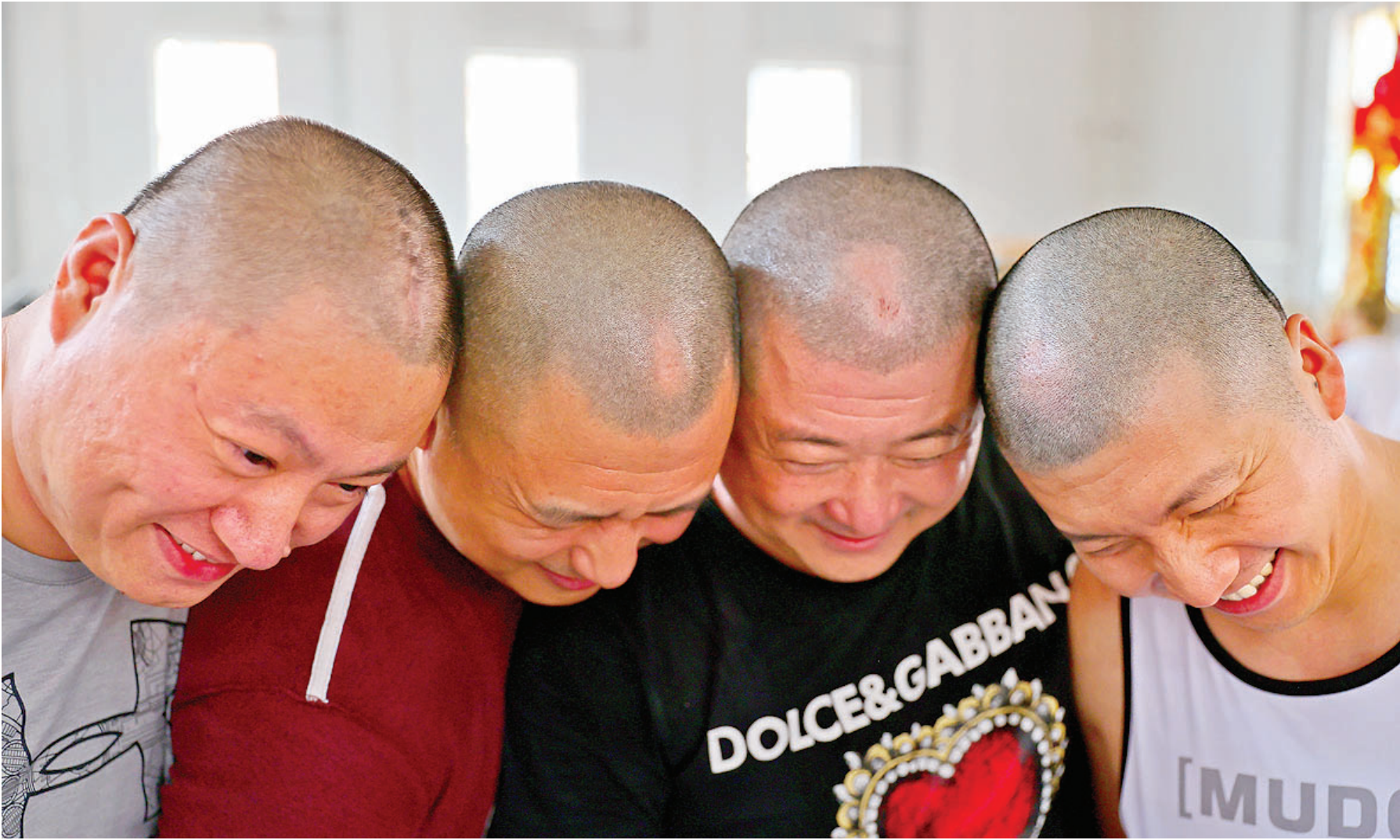
哥儿几个头上的疤痕,是岁月的记忆也是友情的见证。