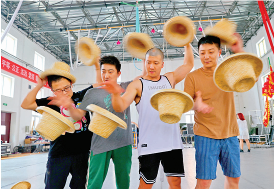
翻飞的草帽,考验的不只是技巧更是队员之间的默契。