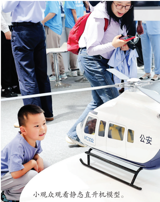
小观众观看静态直升机模型。 基于对未来中国通用航空发展环境的综合评估,预计未来10年中国民用直升机飞行时间将总体呈增长趋势。

本报讯 (记者 胡萌伟)昨天,中国航空工业集团有限公司在天津直博会上举行《民用直升机中国市场预测年报(2023—2032)》新闻发布会,发布了对未来10年民用直升机中国市场的最新预测。 2022年,中国通航飞行时间达到121.9万小时,同比增长3.5%,其中民用直升机飞行时间约20万小时。中国民用直升机各应用领域中,石油服务业务量最大,年飞行量超过4.5万小时,是市场份额超过20%的唯一作业领域;在工农作业领域,空中巡查和航空喷洒市场份额都在2.5万小时以上;航空应急救援领域,航空护林业务量最大,年飞行量超过2.3万小时,医疗救护、航空搜救等业务量较小,年飞行时间不足5000小时。 2022年底,中国通用航空器机队规模达到3186架,其中民用直升机机队规模为1037架,轻型直升机仍然是我国民用直升机机队的主力,占比达到40%;以活塞直升机为主的超轻型直升机也占据了37%的市场份额,其余级别直升机分享了剩余的约23%市场份额。 基于对未来中国通用航空发展环境的综合评估,在经济社会快速发展的推动下,中国通用航空产业将保持快速发展,预计未来10年中国民用直升机飞行时间将总体呈增长趋势,到2027年直升机飞行总量突破26万小时,到2032年突破37万小时。在中国全面实现低空空域开放的预期下,中国民用直升机飞行时间有望在2032年达到近50万小时的水平。 按照中国经济发展水平和民用直升机行业发展情况,预测到2027年,中国民用直升机机队规模将达到1449架;到2032年,机队规模将超过2000架,其中民用涡轴直升机机队规模将超过1200架。在低空空域开放的利好预期下,2023—2027年中国民用直升机总需求量将超过500架,2027—2032年总需求量将超过1000架。