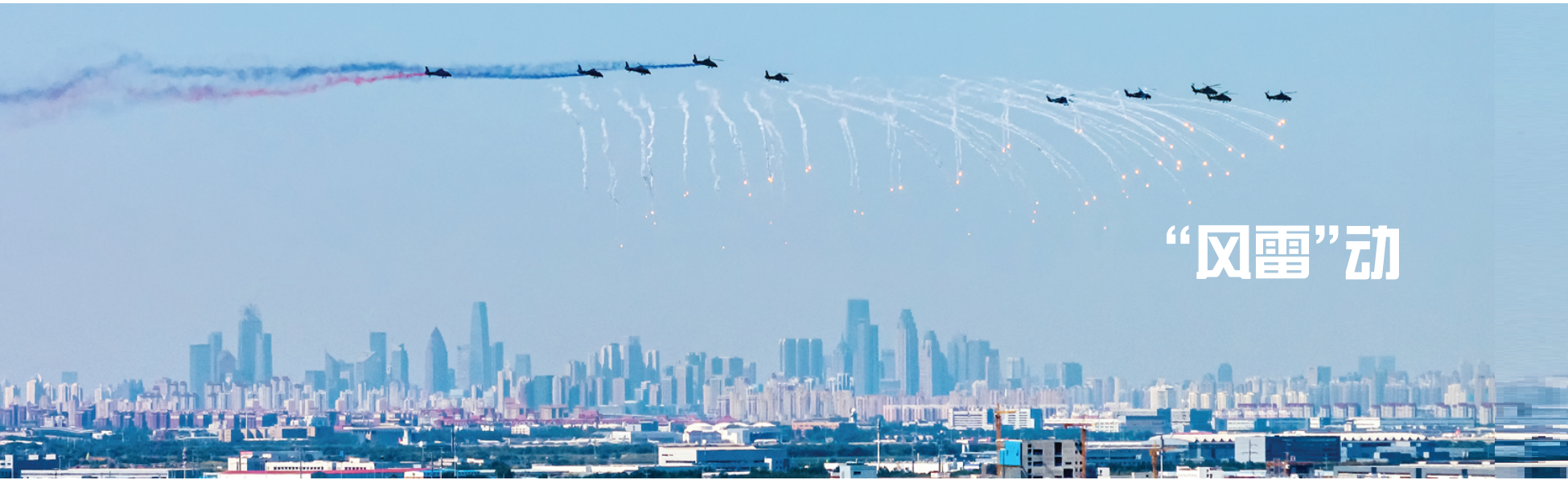
▲▼陆军“风雷”飞行表演队昨进行飞行表演。

本报讯 (记者 张璐)近日,市统计局社情民意调查中心对我市1000名常住居民开展电话调查,了解我市居民对文化消费方面的需求及满意度评价,加速释放文化消费潜力。 调查显示,我市居民对文化消费的整体满意度为89.6%。具体看,满意度从高到低依次为:产品质量(91.7%)、文化氛围(90.5%)、售后服务(90.0%)、产品种类(89.3%)、行业管理(89.3%)、文化设施(88.5%)、产品价格(87.5%)。 调查显示,我市居民最喜欢的文化娱乐方式为看电视及观影,占比为87.0%,其次为浏览网络视频(86.4%),排在第三位的是旅游(77.2%)。参与度超过半数的还有阅读书籍、报刊(64.6%)和参观博物馆、主题展览(61.4%)。 购买景区门票(57.3%)和文化休闲娱乐产品(51.6%)是居民文化消费支出中占比最高的两项,占比超过两成的消费支出还包括:欣赏文艺表演、展览(26.8%),购买广播电视电影产品(26.1%),购买新闻、信息出版物(21.3%)。 最能够吸引居民进行文化消费的因素是子女教育(特指面向未成年人的文化艺术类培训),占比为54.7%;占比超过四成的是健康养生(49.7%)、历史传承(48.3%)和民俗风情(44.7%)。