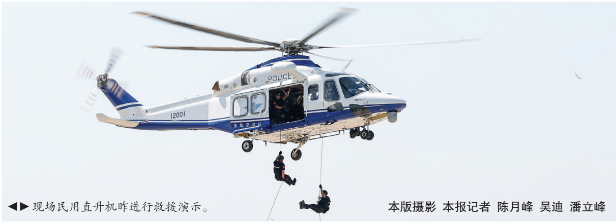
◀▶ 现场民用直升机昨进行救援演示。