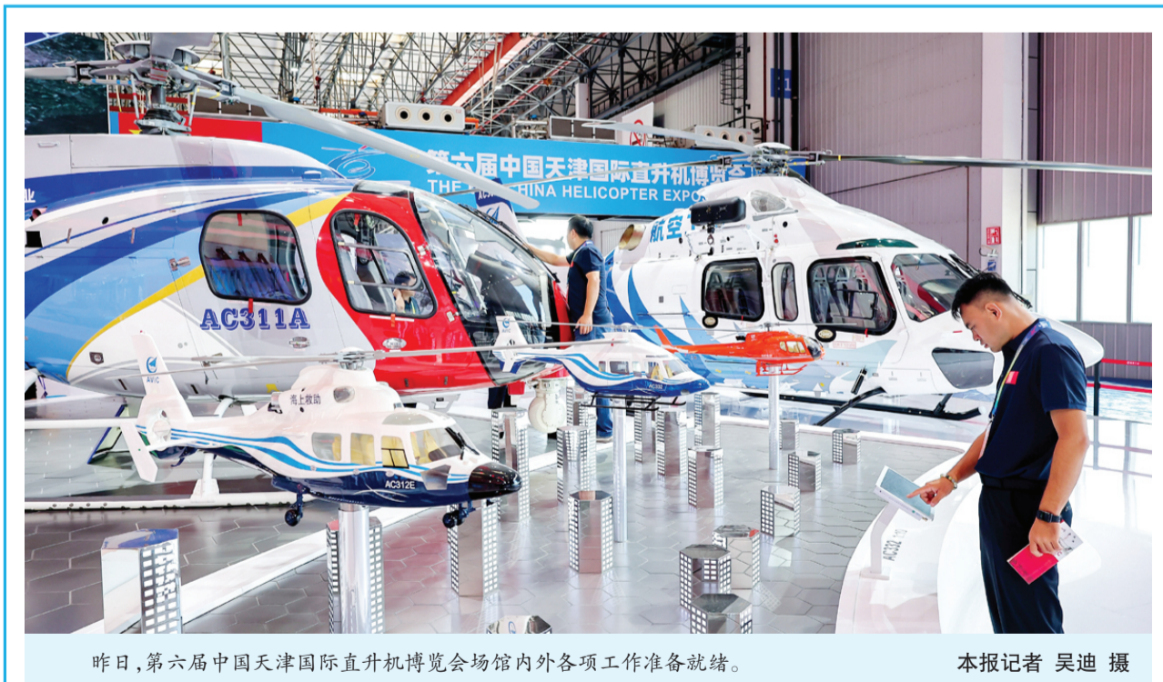
昨日，第六届中国天津国际直升机博览会场馆内外各项工作准备就绪。

张工说，新疆工作在党和国家全局中具有特殊重要位置。近年来，自治区党委和政府、生产建设兵团全面贯彻习近平总书记对新疆工作系列重要指示批示精神，坚持依法治疆、团结稳疆、文化润疆、富民兴疆、长期建疆，各项事业取得了令人瞩目的成就，值得我们学习借鉴。(下转第2版)