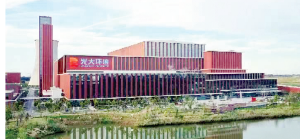
天津光大辰环保能源有限公司助力实现生活垃圾无害化处理、资源化利用。

当垃圾进入焚烧生产线，在45兆瓦的汽轮发电机组的带动下，垃圾成为发电的燃料。据统计，这里每天收储的1200吨垃圾经过燃烧可以发电达60万度，除了少部分用于再生产之外，其余电量都并入了国家电网。(下转第2版)