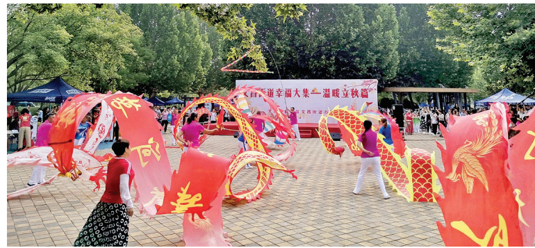
文昌街道举办“幸福大集——温暖立秋篇”活动。

王大爷之前从微信群里看到工作人员要来的通知,这天一大早就到了“居民说事坊”。老人说:“现在认证要用智能手机,我不会也不敢操作,多亏了咱们工作人员,一小会儿就办完了。”