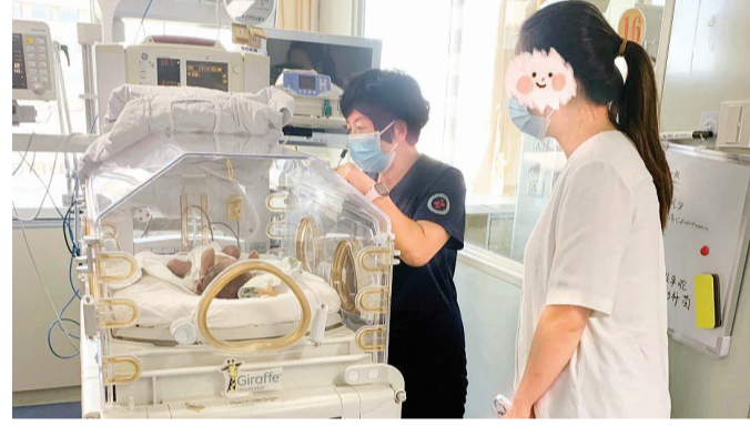
市第一中心医院新生儿科在全市率先引入国际最新的家庭参与式照护模式，让新生儿家长进入病房，学习并参与患儿住院期间的照护。

本月17日上午，市第三中心医院血管外科联合超声医学科将举办“下肢静脉曲张疾病”义诊活动，地点在该院门诊二楼超声科诊区。