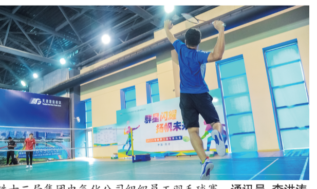
中铁十二局集团电气化公司组织员工羽毛球赛。