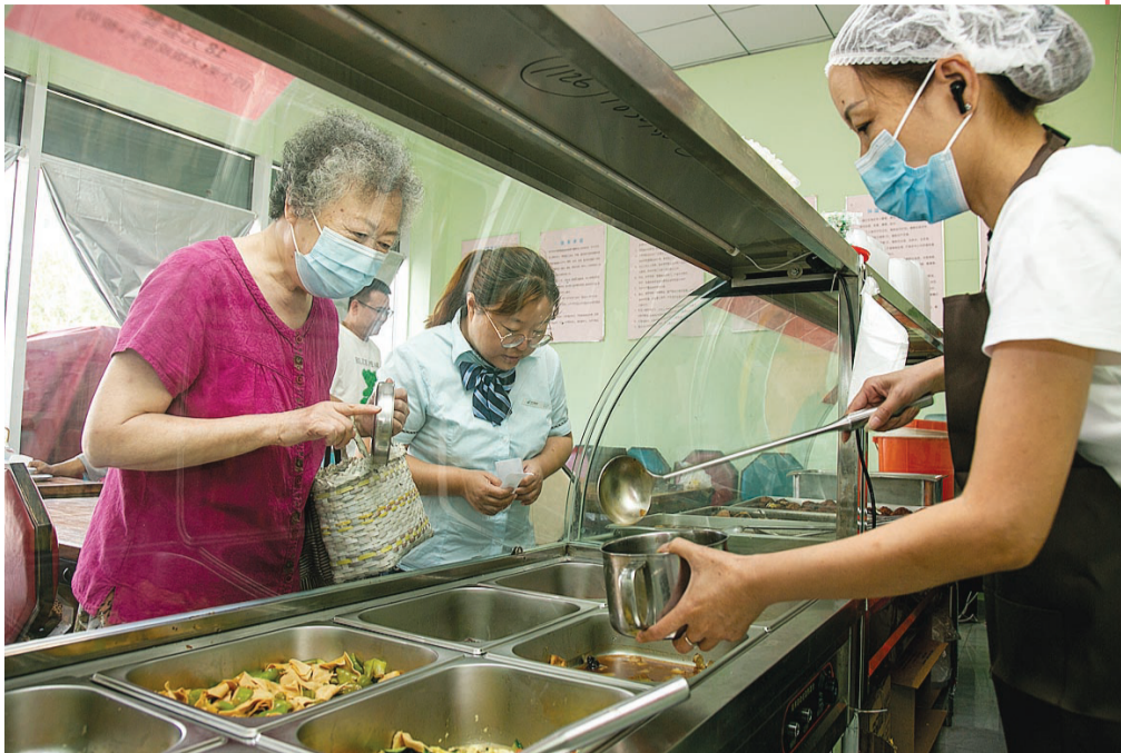
河东区常州道综合为老服务中心里的老人食堂，每天中午堂食、外带的老人络绎不绝。